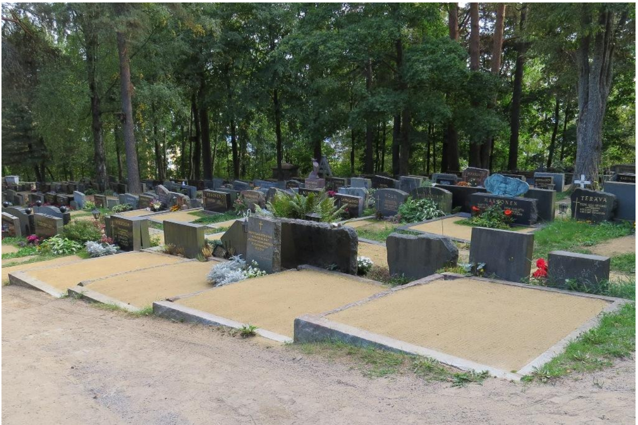
Elisenvaaran pommituksen uhrien hauta Säamingin hautausmaalla. Hauta-alue käsittää neljä tasannetta ja hautakiven. Kivessä on teksti:

Ilmapommitus tapahtui Elisenvaaran risteysasemalla 20.06.1944. Pommituksen uhrin haudattiin Kurkijoen Otsanlahden, Savonlinnan ja Säamingin hautausmaalle. Sotilaat ja lotat haudattiin Kurkijoen sankarihautaan. Savonlinnan ja Säamingin siunaustilaisuus pidettiin vasta marraskuussa 1944, jolloin siunattiin myös pommituksen uhreja poissaolevana. Muistomerkit paljastettiin 16.11.1946.